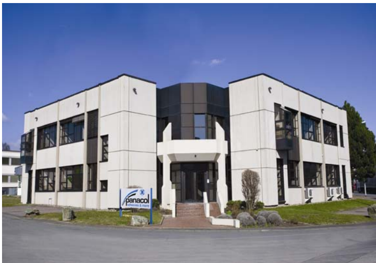
Neuer zentraler Klebstoffstandort in Steinbach bei Frankfurt/Main

Insgesamt geht der Vorstand von steigenden Umsätzen und einem wieder besseren Ergebnis für das dritte Quartal aus.