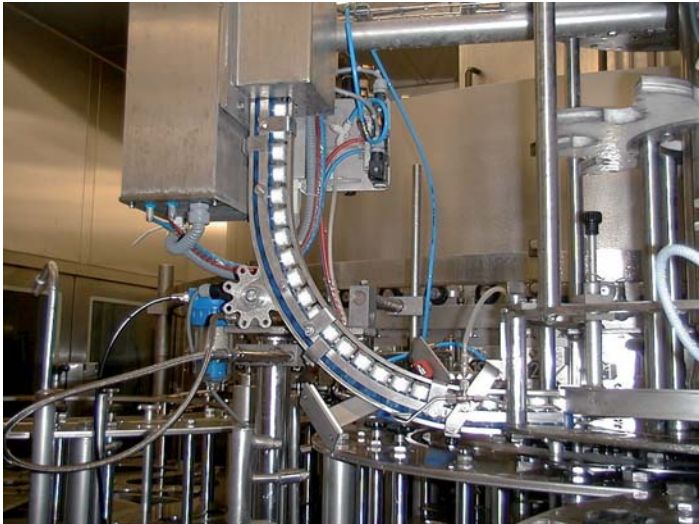
UVATEC lors de la désinfection de bouchons dans l'industrie des boissons