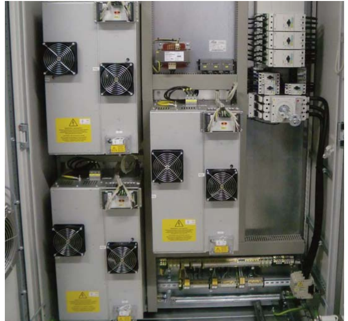
Schaltschrank mit EPS 340 Vorschaltgeräten